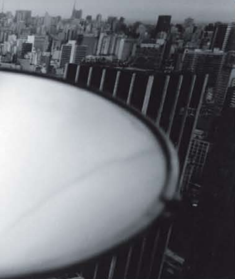
Alcune fotografie di Mimmo Jodice (qui sopra con la moglie Angela) esposte al Palazzo delle Esposizioni di Roma: in alto a destra, «Amazzone da Ercolano» (2007); al centro, «San Paolo» (2003); in basso da sinistra, «Terni. Saldatore» (1976), «Napoli» (1987), «Attesa» (1999) ed «Ercolano n. 2» (1972)