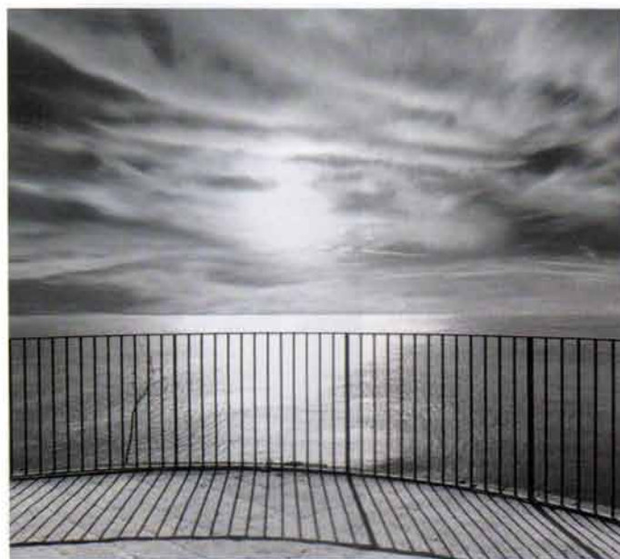
Marelux n. 2, 2009