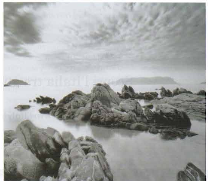
Punta Pedrosa, 1998

Although her name and works are directly linked to her native city, the whole world has been the subject of her photographs, and her matchless artistic versatility has made her one of the most acclaimed photographers of all time. Her images include portraits and landscapes, cities of the world and small islands, studies and experimentation. And the great sea, the Mediterranean.