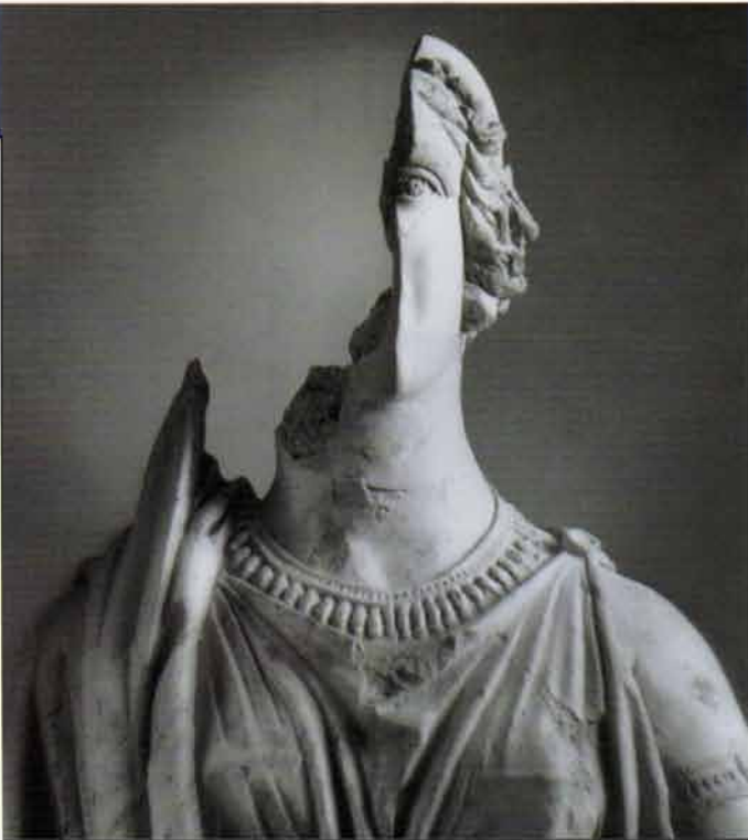
MIMMO JODICE Palazzo delle Esposizioni di Roma - fino all'11 luglio MIMMO JODICE. FIGURE DAL MARE Certosa di San Giacomo - Capri - dal 10 luglio al 4 settembre

greatest of contemporary Italian photographers, Mimmo Jodice. Born in Naples in 1934, her photos tell the story of "a journey that starts from the infinite expanse of the sea and leads us to the infinite dimension of isolation." To find out more, there are two great exhibitions celebrating this journey at the Palazzo delle Esposizioni in Rome and the Certosa di San Giacomo on Capri.